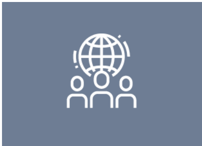
Neues vom FNG